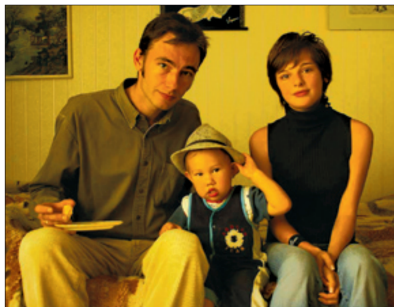
De activiteiten rond het thema 'Mijn familie' moeten kinderen wijzen op verschillende gezinssituaties.

les wordt besproken, om te zien hoe verschillend elk verhaal kan zijn. Uiteindelijk onthult Karin Beerten het slot van het boek en wordt vergeleken hoe dit te rijmen valt met wat gespeeld werd. In andere workshops gaan over liefdesbrieven, tekenwoorden, graffiti, slogans maken en the-