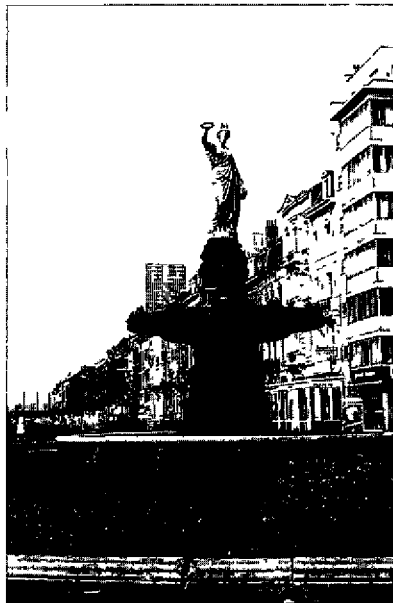
Het J.N. Rouppemonument op het gelijknamige plein te Brussel.

Op 30 juli 1841 werd door een beslissing van het stadsbestuur de "place de la station du chemin de fer du Midi", aan het uiteinde van de Zuidstraat, herdoopt tot het Rouppeplein. Enkele maanden later, op 7 november 1841 werd door het schepencollege beslist om in de onmiddellijke omgeving de benaming Vesaliusstraat te wijzigen in Rouppestraat.