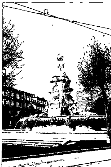
Het Charles DE BROUCKEREMONUMENT, aan de Jan Palfijnlaan te Laken.