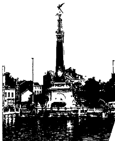
Het Anspachmonument aan de Brandhoutkaai / Baksteenkaai te Brussel.