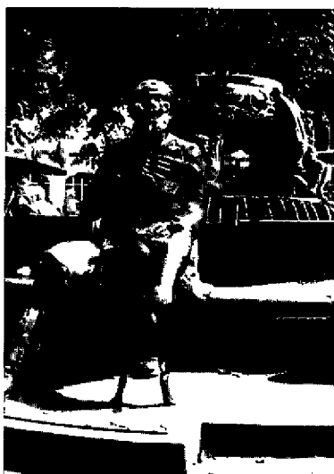
Het Karel Bulsmonument aan de Grasmart te Brussel.