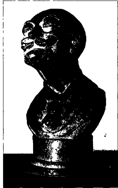
Borstbeeldje van Adolphe MAX, bewaard op het Stadsarchief van Brussel.

Onder zijn ambtsperiode werd ondermeer de Natiënlaan (nu de Franklin Rooseveltlaan) aangelegd (1920). De Koloniënstraat werd aangelegd en de straten en huizen op het traject van de Noord-Zuidverbinding verdwenen onder de slopershamer. De werken voor de Noord-Zuidverbinding waren gestart. Het Paleis voor Schone Kunsten van architect Victor Horta werd voltooid (1928) en het havendok werd gedumpd, zodat de nieuwe IJzerwijk ontstond (1911). Het Sint-Pietersziekenhuis werd gemoderniseerd (1920) en het Brugmannziekenhuis werd geopend (1923). De voorhaven werd opgericht (1920) en Brussel-Zeehaven werd geopend (1922). Dit betekende een nieuwe sterke economische troef voor Brussel. De Heyzelhoogvlakte werd geurbaniseerd en vooral het gedeelte gelegen tussen de Houba de Strooperlaan en het Universitaire Ziekenhuis Brugmann (1930).