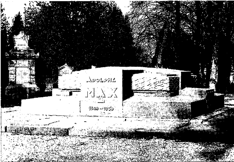
De grafombe van Adolf MAX op de stedelijke begraafplaats van Brussel-Stad te Evere.

Burgemeester Adolphe Max bleef ongehuwd en woonde in het ouderlijk huis in de Leopoldswijk, Jozef II straat 57, waar hij op 6 november 1939 overleed ten gevolge van een longontsteking, die gepaard ging met een zware griep. Zoals meerdere van zijn voorgangers overleed ook Max als burgemeester in functie. Zijn burgerlijke begrafenis-uitvaart had plaats op 9 november om 14.30 u. Het herenhuis van de familie Max in de Jozef II straat werd omwille van de stadsvernieuwing in 1962 afgebroken.