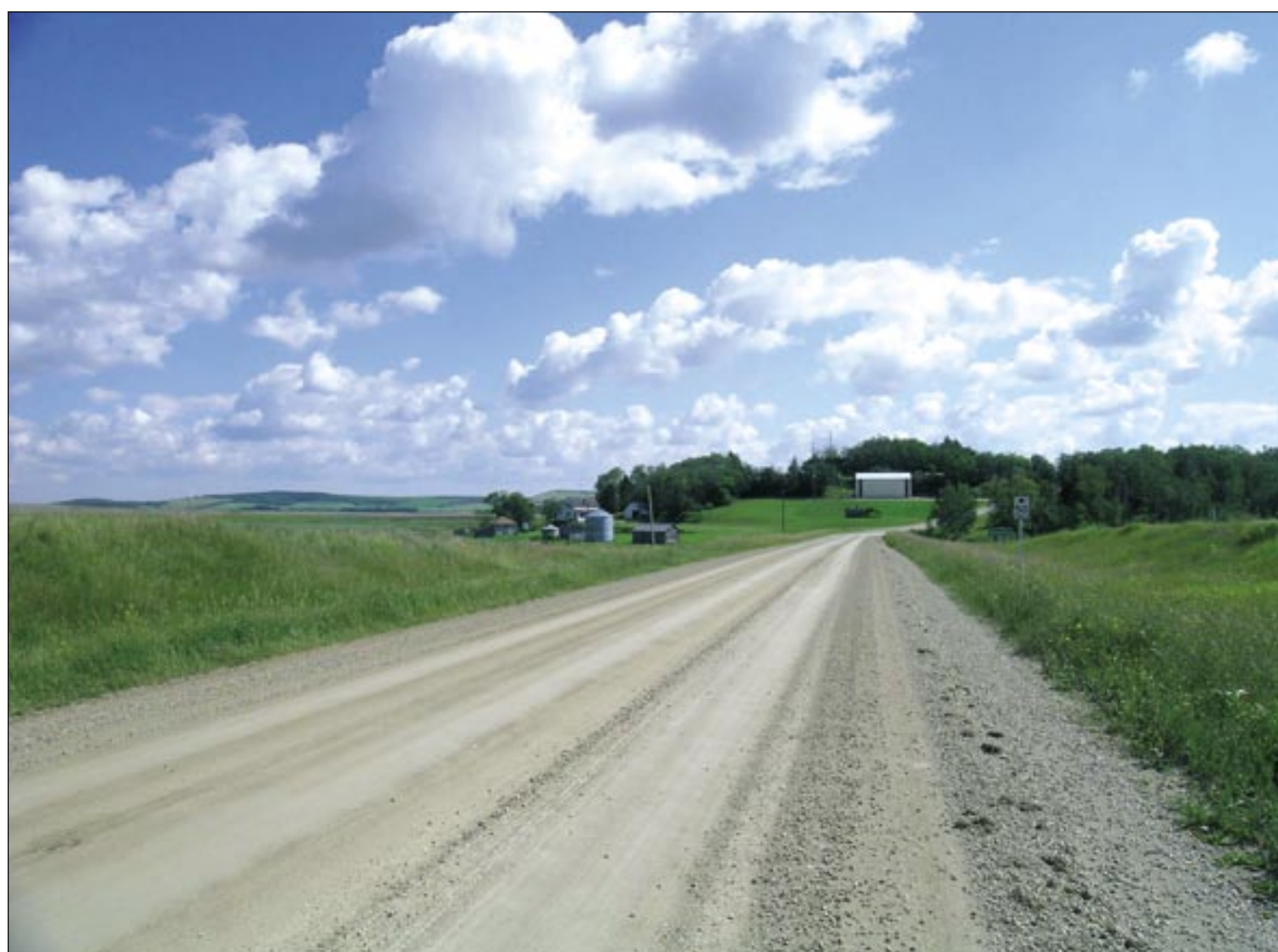
"Ja, ik ben fier op mijn Belgische afkomst. Kijk maar naar mijn sleutelhanger: een tricolor exemplaar."

Ook andere 'nieuwe Canadezen' konden de Belgische sfeer met schuim overigens wel smaken, zodat de Belgian Club een florissante vereniging werd, die ook een sociale voortrekkersrol opnam en mee het (katholiek getinte) welzijnswerk financierde. De Kerk (en haar Belgische pastoors) stampte in de pioniersjaren overigens flink wat structuren uit de grond waar Belgische