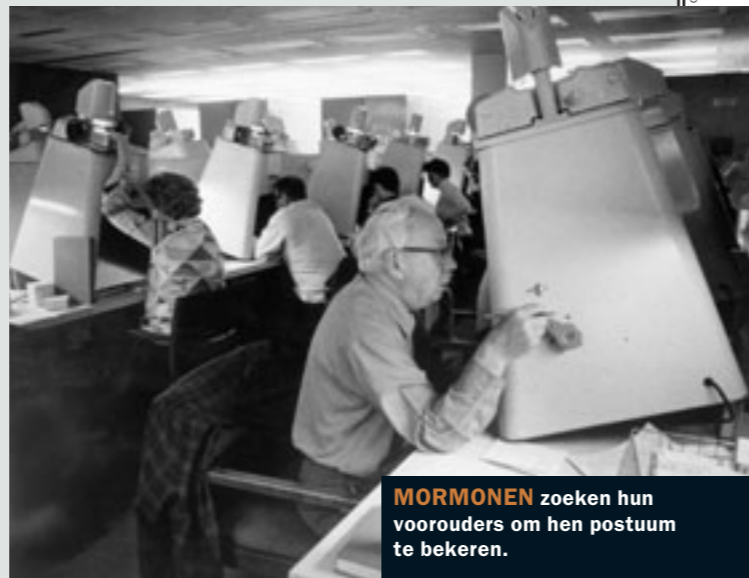
MORMONEN zoeken hun voorouders om hen postuum te bekeren.

MARIEN: Zoiets. Maar ze moeten het wel zelf willen. Onze voorouders, die na hun dood in de geestenwereld verder leven, kunnen die 'verbonden', zoals wij dat noemen, aanvaarden of verwerpen. Wij bieden hen een kans, dat is alles.